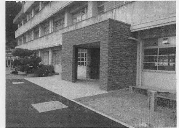
久井コミュニティセンター 久井歴史民俗資料館